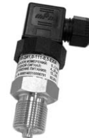
Пер. № 79