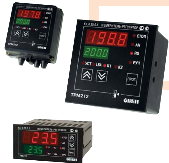
Класс точности 0,25/0,5